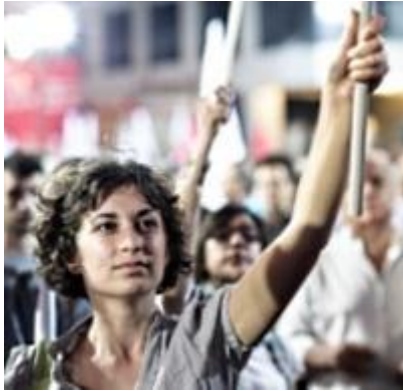
D. Seitz, o.T., 2012 (Detail)

Apulische Kulturtage im Museum Europäischer Kulturen werden am Sonntag, dem 5. August 2012, 16:00 Uhr - 22:00 Uhr bei freiem Eintritt eröffnet. Es gibt Live Musik griechischer Musiktraditionen aus Apulien mit der Gruppe Ghetonia und Tanz-Performance mit "TarantaScalza". Ghetonia ist eine Musikgruppe aus der Grecia Salentina in Apulien, einer Gegend mit einer seit der Antike dort angesiedelten griechischen Minderheit. Es werden apulische Spezialitäten von Berliner Gastronomen angeboten. Veranstaltungsort: Garten des Museums, Arnimallee 25 in Berlin-Dahlem. Bis zum 26. August 2012 gibt es Führungen durch die Ausstellung "Erkundungen", Filme, Vorträge, Exkursionen, Tanzworkshops und Musik.