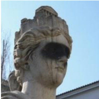
K.T. Blumberg, "Athena", 2012