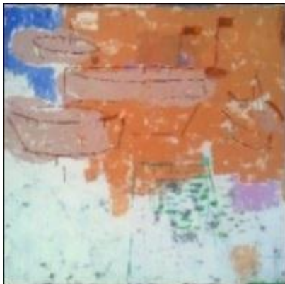
Frank Gottsmann, o.T., 2011, Acryl auf Leinwand

(zitiert nach Süddeutsche Zeitung vom 4./5.2.2012)