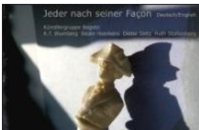
B. Hoerkens, "Leid und Leidenschaft", 2011, C-Print Alu-Dibond

Der Katalog ist in den Museumsshops der "Stiftung Preußische Schlösser und Gärten" sowie im Buchhandel und natürlich in der Galerie zum Preis von 13,90 € zu erhalten.