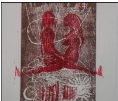
Michael Arantes Müller, "phantastereien", alchimi, 2011, Büttchen, 1/25, (Detail)