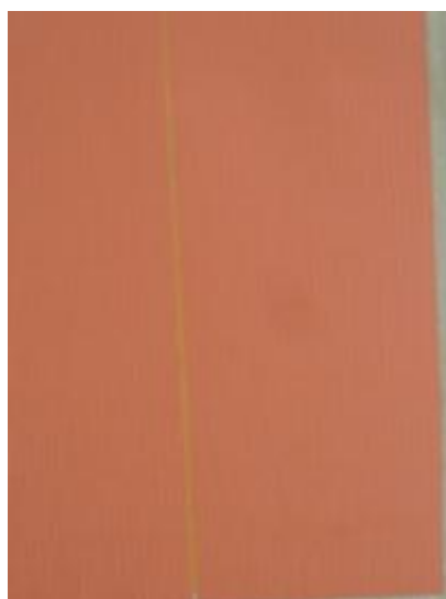
Johannes Geccelli · KORALLTON KIPPT · 2000 · Öl auf Leinw. (Detail)