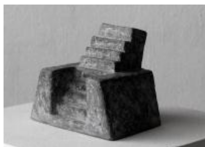
Ute Hoffritz, "Kleiner Thron", 2008, Betonguss, 5/20