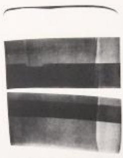
Hans Hartung, "L-19-1976", 1974, h.c., Lithographie auf Rives