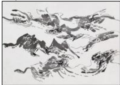
Malkin Posorski, o.T., 2010, Bütten, japanische Tusche, Blei (Ausschnitt)