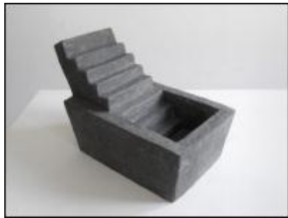
Ute Hoffritz, "Römisches Bad", 2010, Beton