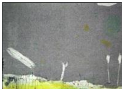
Falko Behrendt, Sonnenfinsternis, 2001, Farbradierung