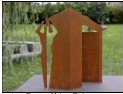
Andreas Theurer, "Offene Tür", 2008, Stahl