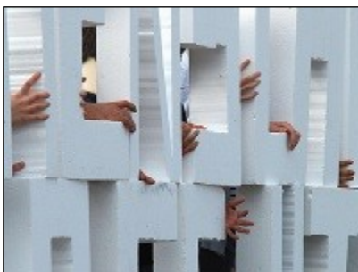
© K.T. Blumberg, aus der Serie: "Parcours real"

Pomona Zipser, „Wie's um mich steht“, 2009, Holz, Strick, Metall, Farbe, 45 x 55 x 40 cm