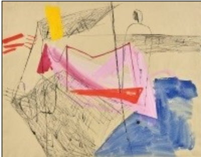
Joachim Böttcher, "Am Meer", 1985, Feder, Tusche, Pinsel, Wasserfarben auf Ingrespapier, 48 x 62,4 cm, VG Bild-Kunst, Bonn

So lautet das Motto von sechs Einrichtungen der Bildenden Kunst, die sich 2018 wieder an der "Stadt für eine Nacht" ( SFEN ) in der Schiffbauergasse beteiligen. Von Samstag, dem 30.6. bis Sonntag 1.7.2018 von 14 bis 14 Uhr findet das Kulturfestival in diesem Jahr zum neunten Mal statt. Kunst, Musik, Tanz, Theater, Film und mehr: draußen und drinnen. Immer Eintritt frei.