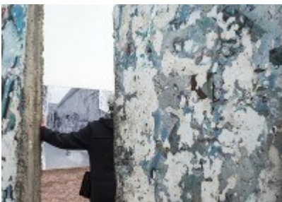
K.T. Blumberg, "Checkpoint Charly", 2018, 84,1x 118,9 cm, Aufl. 7