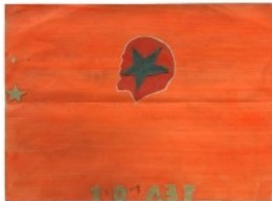
Achim Freyer, "10+1 Let", um 1970, Mischtechnik auf Papier, 30 x 41 cm

Eintritt: 8 € (ermäßigt 6 €), Reservierung: hier .