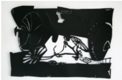
Pomona Zipser, "Überfahren", 2011: Scherenschnitt/ Collage, 70 x 100