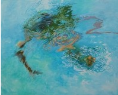
M. Posorski, "Schwimmer XV", 2017