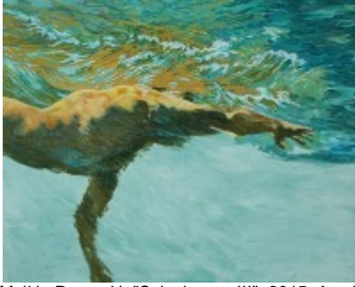
Malkin Posorski, "Schwimmer III", 2015, Acryl auf Leinwand (zu sehen in der o.g. Ausstellung)