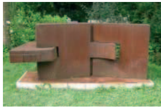
Stephan J. Möller , "Artikulus", 2000, Stahl