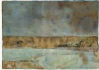
Christian Heinrich , "Somewhere in Africa I", 2014, Ölcollage auf Büttchen, 22 x 30,5 cm, wvz 4155