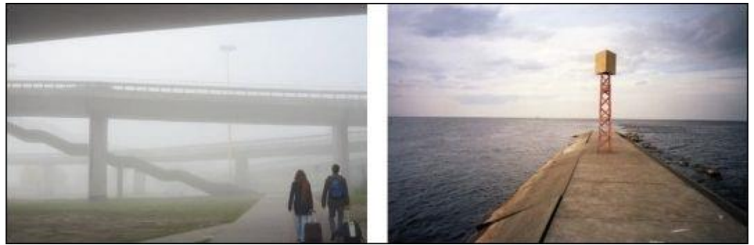
K. T. Blumberg, Szczecin 01, 2012, C-Print