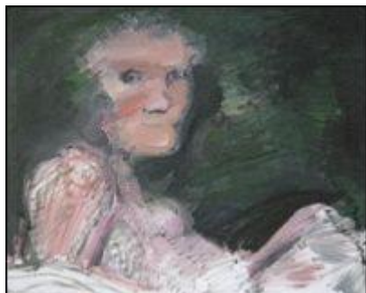
Hans Vent, "Im Grünen", 2012, Öl auf Leinwand