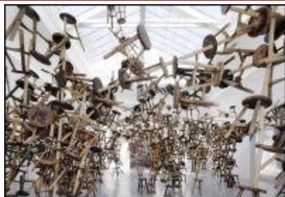
Installation von Ai Weiwei als deutscher Beitrag im französischen Pavillon