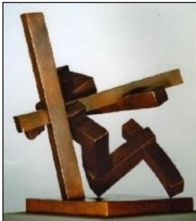
Volker Bartsch, "Flötistin", 2003, Bronze 37x37x30 cm, mehr hier