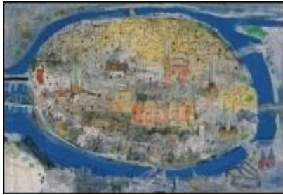
Falko Behrendt, "HL", 2012, Pigment-Druck, 20/50